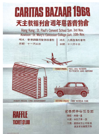
1968年天主教福利會賣物會及獎券的宣傳海報