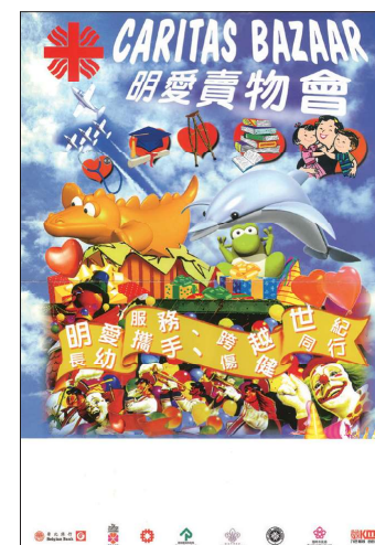
1992年明愛賣物會的宣傳海報