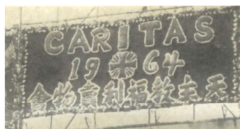
1964年的天主教福利會賣物會

1961年，白英奇主教成立了一個委員會，專責籌備大型的籌款活動，籌募所得的款項則用來營運福利會的救濟服務。這個委員會由香港天主教福利會會長石抱璞副主教擔任主席。白主教於8月12日致函港府，通報籌款活動的相關資料：活動包括一項抽獎券和兩個賣物會，並期望港府能借出位於香港島的夏慤道展覽場地和位於九龍的警察遊樂會，以舉行賣物會。因為政府各部門對於舉辦賣物會，尤其是使用政府部門的場地意見不一，最終白主教決定在兩間天主教香港教區轄下的中學舉辦賣物會，分別是香港島的聖保祿學校和九龍的華仁書院。賣物會於11月5日在香港島和11月12日在九龍順利舉行；港島區的賣物會邀得輔政司白嘉時伉儷主持開幕禮。這次參加賣物會的單位全為天主教香港教區的堂區、學校和機構，攤位達52個，除了日用品攤檔外，亦有不少遊戲攤位。賣物會入場人數多達20,000人次，籌得600,000元善款。 1 由於第一次賣物會的成功，其後一年一度的賣物會便成了天主教福利會的傳統。