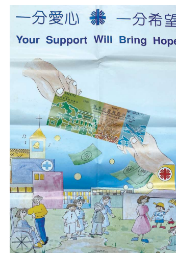
1992年明愛獎券的宣傳海報

每次賣旗籌款活動，香港明愛都會募集各界義工參與服務，透過活動向社群表達愛與關懷，與堂區、天主教中小學和天主教團體一起攜手播種主愛，讓彼此的關係變得更加緊密，團結共融。