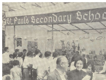
市民踴躍參與攤位遊戲

1974年，香港天主教福利會更名「香港明愛」，賣物會亦隨之改名為「明愛賣物會」。「明愛賣物會」對香港明愛維持服務曾扮演重要的角色，如右圖所示，1974年賣物會所得收入佔福利會全年總收入超過60%。