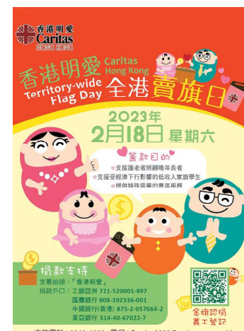
2023年賣旗籌款活動的宣傳海報