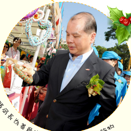
張局長為善最樂，購買「愛心熊」飾物

謹再次衷心感謝各位善長的慷慨捐輸、義工朋友的鼎力協助、堂區教友和老師同學的積極參與、還有是各界有心人士的踴躍支持。期待明年在賣物會再與大家見面。