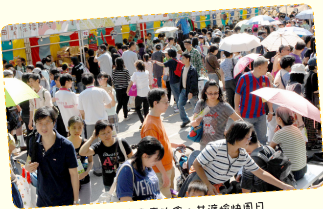
男女老少齊來參與賣物會，共渡愉快周日