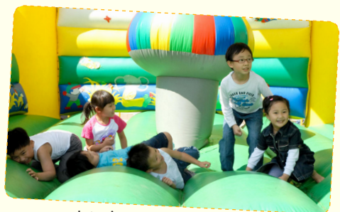
小朋友在兒童園地開心遊玩