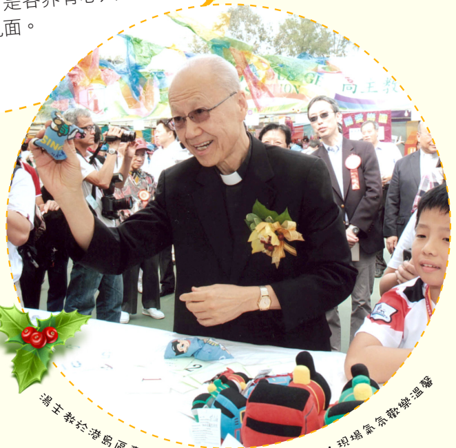
湯主教於港島區賣物會參與攤位遊戲，全情投入，現場氣氛歡樂溫馨