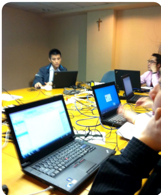
明愛資訊科技創建中心同事向醫院職員講解如何使用「醫院資訊系統」

資訊科技在醫療界的應用其實極之廣泛，以上只一些簡單例子。廣泛應用的背後，當然需要一套完整的資訊系統支援。明愛資訊科技創建中心（CITAC）致力研發之「醫院資訊系統」已於十月中在寶血醫院（明愛）成功實施，正式標誌著本中心於醫療資訊科技發展上邁入新里程碑。本中心同事於研發系統工程上努力不懈，最終獲得醫院管理層讚賞，實在令人鼓舞。而嘉諾撒醫院（明愛）之「醫院資訊系統」亦如箭在弦，快將實施。