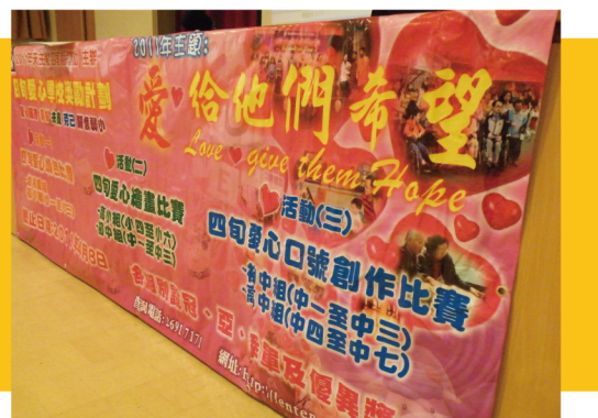
明愛員工協助組織及推廣天主教四旬期運動之工作

委員會秉承團結共融的精神，撥款予海外和本地用作緊急賑災活動，合共50萬元。在這方面，香港明愛提供了行政和文書支援。