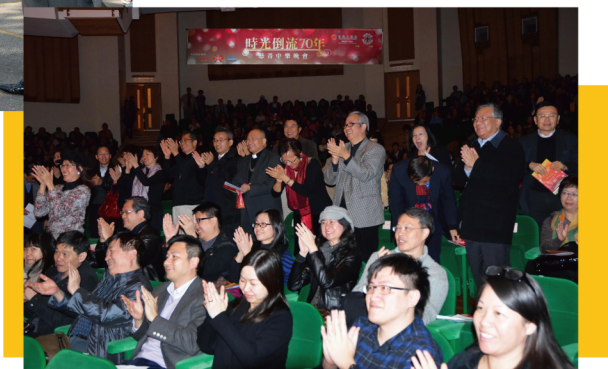
「時光倒流70年」慈善中樂晚會 — 樂團的精彩演出，贏得觀眾熱烈的掌聲