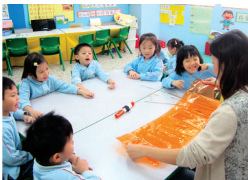
● 家長義工指導兒童學習怎樣製作風箏

為培育兒童的創意能力及邏輯思維，在課程推行時引用了問題導向學習策略，兒童對不同的自主學習課題，包括：「風箏」、「米飯」、「杯子」和「雨傘」等，都進行了深入的探究，增強了兒童的語言能力與思考能力。