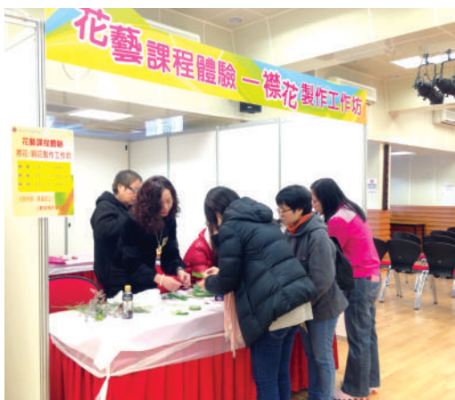
● 僱員再培訓局課程的宣傳活動

社區書院於2014/2015年度舉辦了一系列「僱員再培訓局 — 人才發展計劃」的講座及活動，邀請多間僱主機構參與，為學員提供不同的課程和相關的就業資料。