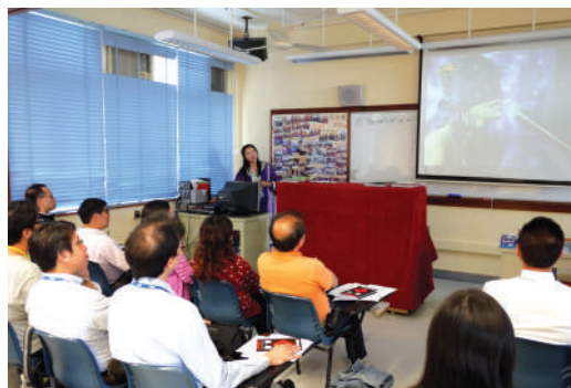
● 小組討論及工作坊