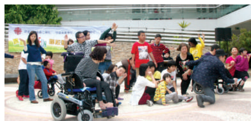
● 學生、教職員及義工合演「共生舞」