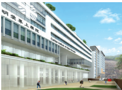
● 專上學院將軍澳新校舍

明愛專上學院（“專上學院”）將軍澳新校舍的興建計劃已完成了前期工序，並於2014年12月2日把建築地盤移交院校大樓的承建商，啟動上蓋的興建工程。新教學大樓總面積約3萬平方米，可容納3,200名全日制學生。有關工程將於2016年第二季完成，新校舍擬於2016/2017學年啟用。