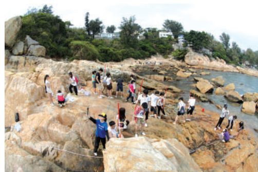
● 學生進行野外考察

明愛陳震夏郊野學園位於長洲，為本港的教師及學生提供自然生態及地理考察課程，同時亦提供課程予普羅大眾，以提高公眾對環境保護的意識及可持續性發展的關注。