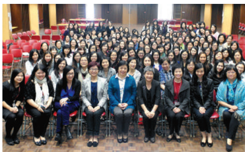
● 全體參加者與主講嘉賓合照