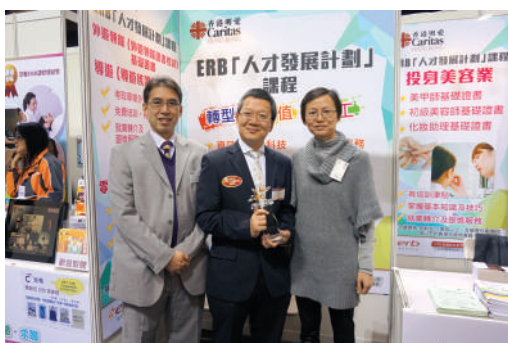
● 人才發展計劃 — 傑出僱主獎得主 — 祥益地產