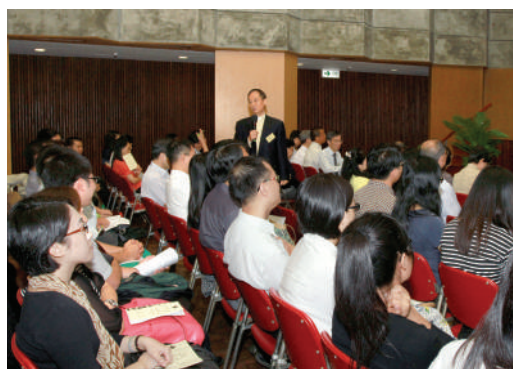
● 介紹香港明愛的歷史、願景、使命及價值觀