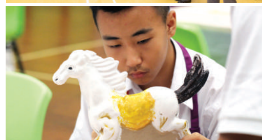
● 明愛中學讓學生接觸不同種類的課外活動