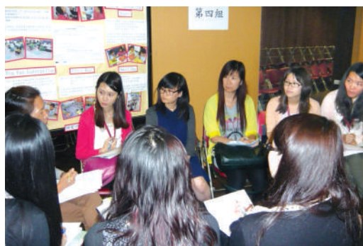
● 有關英語教學的小組討論

本服務為全體學前教育老師舉行了三次聯校教師專業發展日。首次專業發展日在2014年4月30日舉行，主題為「幼兒英語教學 — 策劃、實踐與評估」；服務邀請了香港教育學院幼兒教育學系一位副教授蒞臨主講，題目為「幼兒的英語學習 — 本地幼兒教師面對的議題與挑戰」，是次培訓活動亦同時展出了11間幼兒學校與幼稚園綜合英語學習的教材。