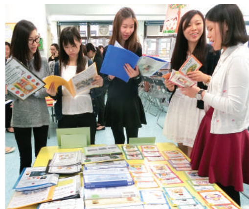
● 教師分享學與教資料

為加強對機構願景、使命與價值觀的認識，本服務在2014年8月23日為新教師舉辦迎新日，共有21名參加者。活動中分享新教師面對的困難與挑戰，並就如何回應機構的願景、使命與價值觀提出建議。此外，在2014年9月至2014年10月期間舉辦了一系列培訓活動，藉以增強教師在兒童課程中實踐天主教教育核心價值的能力。