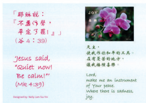
● 新一系列的宗教咭