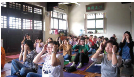
● 教職員在工作坊中學習舒緩運動