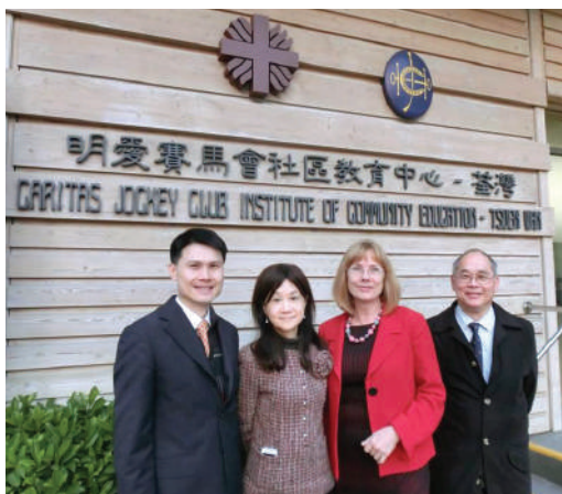
● 澳洲中央昆士蘭大學的Hilary Winchester教授參觀社區書院，並討論有關的升學計劃