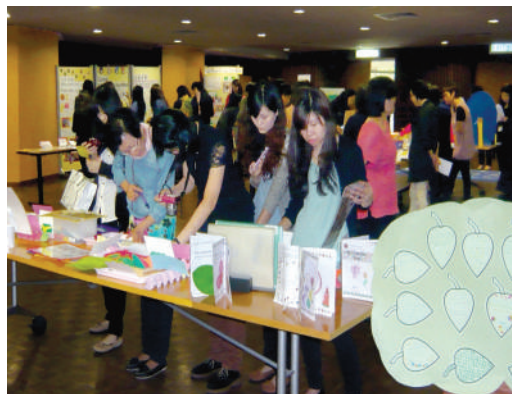
● 英語活動與教學材料展覽

第二次專業發展日在2014年9月30日舉行，主題為「幼兒宗教培育 — 天主教學校的使命與宗教課程」，會上分享了天主教教育的核心價值。此外，天主教宗教及道德教育課程發展中心介紹了厄瑪烏教學法。透過小組討論，參與者也分享推行宗教課程的經驗。