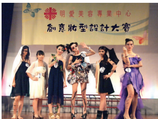
● 創意妝型設計大賽