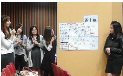
● 小組討論後的匯報

第三次專業發展日在2014年11月28日舉行，主題為「建構學習的實踐與再思 — 問題、探索與經驗」。香港教育學院幼兒教育學系一位助理教授及前任講師被邀請進行專題演講，旨在讓老師於教學實踐中結合「建構學習」的理論，藉以加強兒童在學習過程建構概念知識。