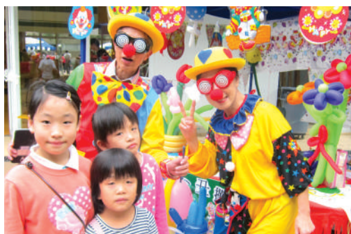
● 明愛麗閣長者中心的義工化身小丑，製作繽紛的氣球裝飾

明愛賽馬會樂仁學校、明愛樂勤學校及明愛樂義學校在2015年3月29日合辦「開心樂滿Fun • 藝術親子嘉年華」，目的為鞏固家庭關係，並為學生及其家人帶來愉快的相聚時刻。當日的遊戲和美食攤位，以及各項舞蹈表演及小型音樂會，實有賴社區義工的大力支持，所有參與者均珍惜那幸福喜悅的日子。