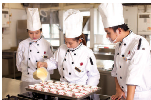
● 從親身製作中學習 — 製作杯裝蛋糕

教育局於2014/2015年度向社區書院毅進文憑課程超過40項學習支援活動提供資助，當中包括妝型設計、籃球訓練和薑餅製作等。同時，社區書院更邀得知名教練翁金鏘先生及李健和先生分別擔任籃球及足球隊教練。