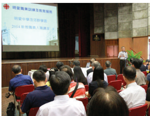
● 中學生成長需要的講座

2014/2015學年明愛中學新教職員入職日 新教職員入職日於2014年9月6日於明愛大廈舉行，活動前為出席者舉行彌撒。入職日主要讓明愛屬下之中學及郊野學園新聘任的教職員了解香港明愛的歷史、願景、使命和價值觀。活動亦包括一個有關中學生成長需要的講座。