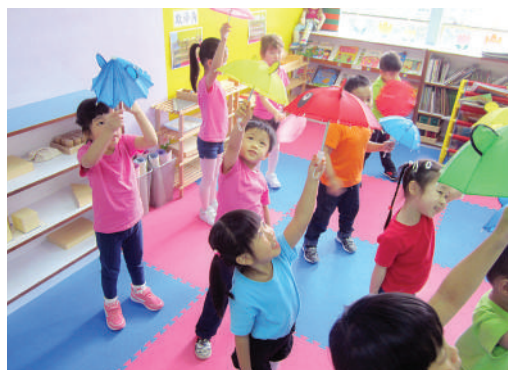
● 「在雨中漫步與唱歌！」