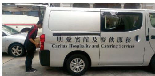
● 明愛白英奇賓館的六座位客貨車

明愛白英奇賓館及明愛張奧偉國際賓館分別於2014年12月及2015年3月更換新的客貨車(六座位)及穿梭巴士(23座位)，為客人提供更有效率的到會及更舒適的接送服務。