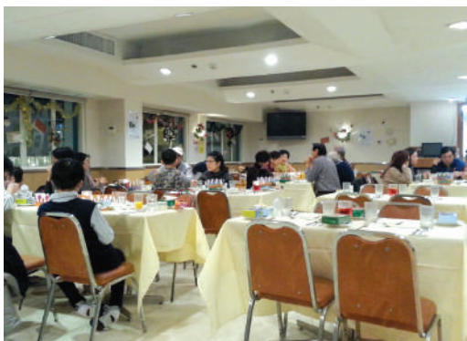
● 明愛咖啡閣於2014年4月重開後的面貌

各餐廳在年內分別進行了改善工程及廚具重置計劃。明愛咖啡閣及明愛白英奇賓館附屬餐廳相繼在2014年4月及2014年11月完成翻新及改善工程，業績逐步回升。