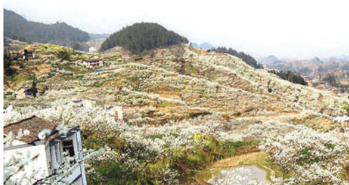
● 荒野地變成一片梨子園