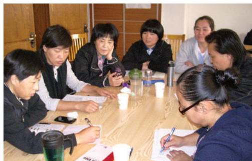
● 河北項目管理課程小組討論