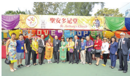
● 在銅鑼灣維多利亞公園舉辦之明愛賣物會