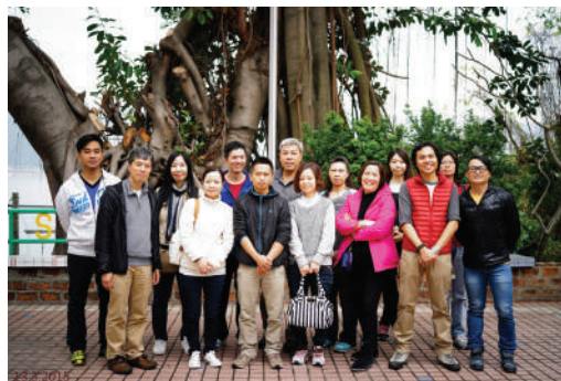
● 於救世軍馬灣青年營拍攝的團體照

2015年共舉辦了兩個訓練活動：分別是2015年3月2日至2015年3月3日到中國陽春的海外考察及2015年3月13日參觀位於馬灣的香港挪亞方舟太陽館度假營及救世軍馬灣青年營。活動重點包括：探討度假服務，經驗分享，營舍行業發展及團隊合作的觀點交流。