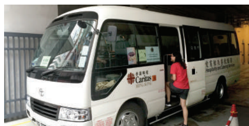
● 明愛張奧偉國際賓館的23座位穿梭巴士