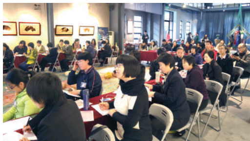
● 在廣州舉行的居家安老服務工作坊