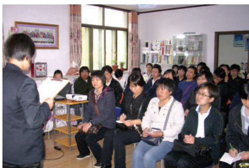
● 在河北省舉行的項目管理課程

鑑於近年國內社會工作服務發展迅速，於是資助一些正從事各種社會服務的修女們參與相關的探訪活動、講座和短期培訓課程，藉此開闊視野、豐富經驗。這些學習活動包括「2014年中國公益慈善項目交流展示會」、「中國幼兒教育工作坊」等，均獲參與者的好評。見聞增廣後，大家意識到有提升服務的需要。