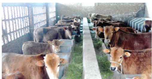
● 重慶市萬州區養牛項目