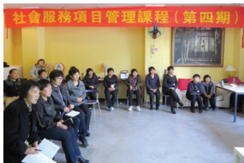
● 在廣東省舉行的項目管理課程