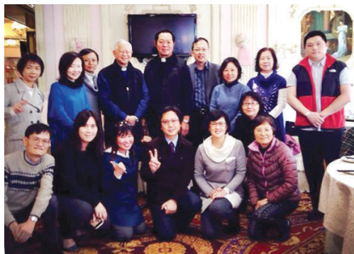
● 鐸區主任司鐸及明愛員工在探訪明愛服務單位前之午膳聚會

此外，地區主任亦為鐸區神父及明愛服務單位主管安排聯誼聚會及探訪，以增加彼此的了解及支持。