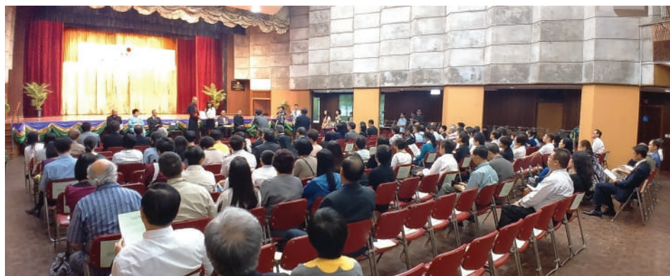
●明愛籌款運動假明愛堅道服務中心公眾會堂舉行閉幕典禮