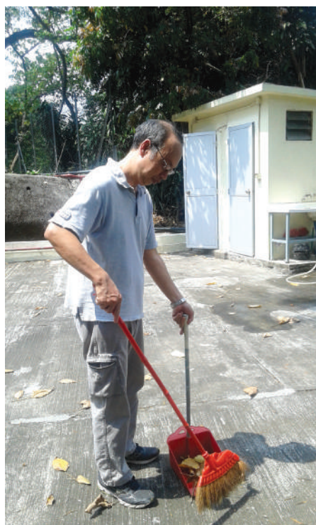
● 庶務員在明愛青衣活動中心清潔

本服務的成效，在於為需要者提供合適的服務。在這年度裏，本服務雖然面對堂區對服務需求的增加、人手短缺和工資上升等種種挑戰，仍能繼續提供可靠的服務予各使用者，並且出現盈餘。同時，本服務更鼓勵員工接受保安和職業安全課程，以提升他們的工作技能及安全意識。