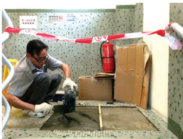
● 庶務員在明愛香港仔服務中心內進行地台重鋪工作