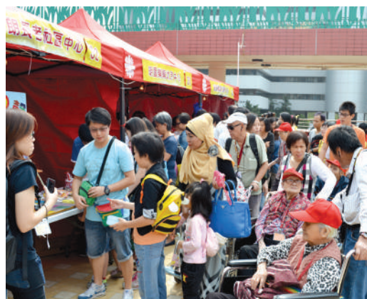
● 來自各階層的人士在賣物會上購買價廉物美之貨品

為推廣明愛天糧包餅工房製造的聖誕及新年曲奇，地區主任聯繫了堂區，安排在堂區售賣其產品，期望其銷售為服務之康復人士帶來更多工作機會。