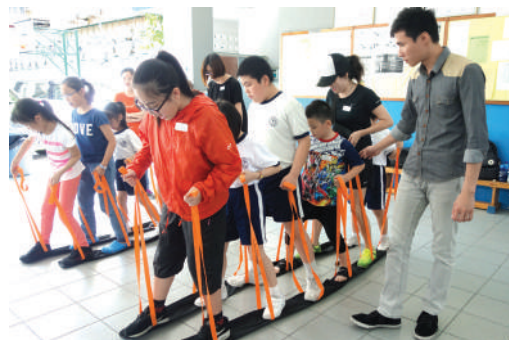
● 明愛、堂區及荃灣三所小學合辦之親子歷奇活動

推廣明愛與堂區、天主教學校 / 幼稚園及教區組織的合作活動，是地區主任其中之一項工作。本年度主要合作活動包括明愛與堂區及小學合辦周年親子歷奇活動、支持堂區籌辦教區的傳教節、到堂區推廣未來座落將軍澳的天主教大學和明愛的新服務、為堂區提供庶務服務，以及聯絡慕道者、教友和學生參與賣物會和慈善步行籌款等愛德活動。