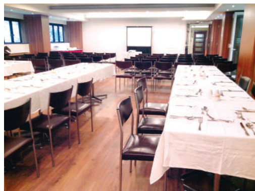
● 於明愛白英奇賓館餐廳舉辦講座