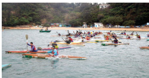
● 第32屆長洲環島獨木舟大賽

第32屆長洲環島獨木舟大賽於2015年3月1日順利舉行。賽事吸引了154位參加者參與各項比賽，更邀請了離島區議員蒞臨擔任主禮嘉賓及頒發獎項。