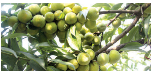
● 重慶市耕種項目採用新的技術培植梨子