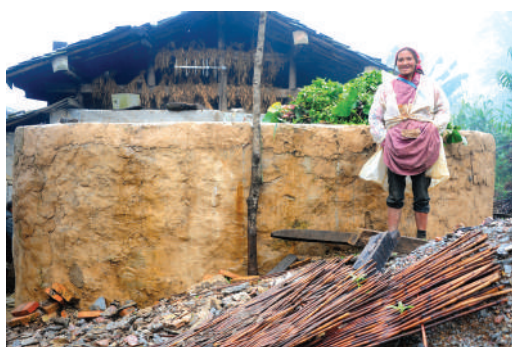
● 雲南山區農婦滿心歡喜站在新建水窖旁留影