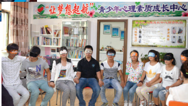
● 河北省寧晉縣青少年中心的提升自信遊戲