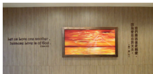
● 明愛白英奇賓館大堂翻新後面貌