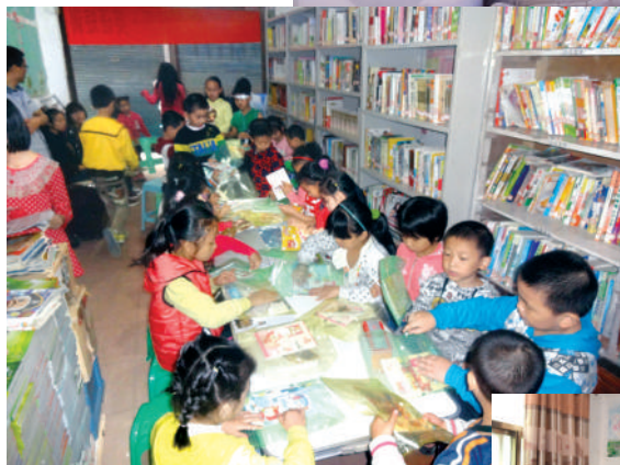
● 重慶市外地民工兒童在圖書館學習