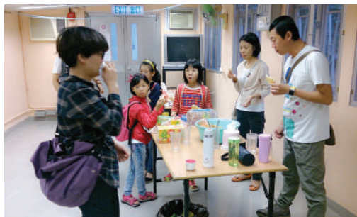
● 營友在活動中心進行親子活動