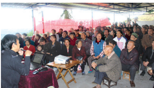
● 農民接受耕種養殖管理和技巧的培訓

最有效益的工作，莫過於使受助者達至自力更新和持續發展。透過明愛的資助，重慶市萬州社會服務中心協助萬州區分水鎮30戶農民家庭組織合作社和拓展養牛業。兩年間，農民不單收入提高，生活質素亦有所改善，而產業也持續成長。牛隻的排泄物可用作在鄰近種植梨子的肥料，而梨子園內的雜草又可用作牛隻飼料；循環利用，物盡天然。農民也獲提供耕種養殖管理和技巧的培訓；當地的耕種養殖業，就因此而發展起來。