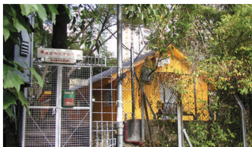
●明愛青衣活動中心

在2014/2015年期間，明愛青衣活動中心積極進行推廣宣傳，致租用率有所提升，期間招待了23個機構合共786位使用者，有8間堂區 / 教區機構及15間志願機構使用該中心舉行退修、會議或燒烤等活動。中心將持續加強推廣和宣傳，以提升來年之使用率。