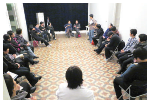
● 廣東項目管理課程分享會