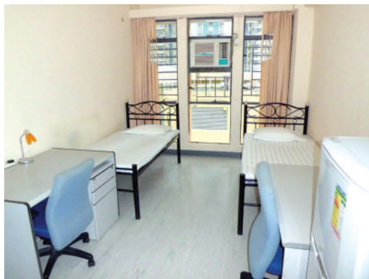
● 明愛牛頭角男學生宿舍