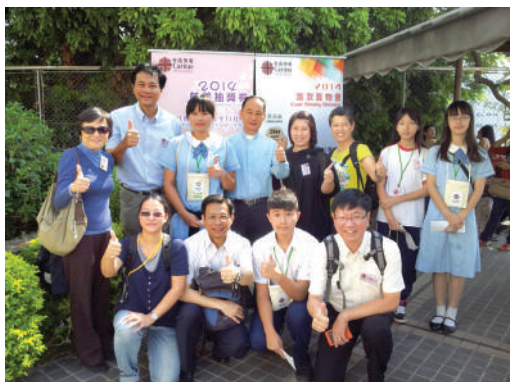
● 副總裁連同明愛員工及義工在聖伯多祿聖保祿堂推廣明愛慈善獎券