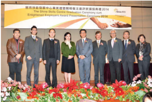
● 開明僱主嘉許狀頒授典禮2014

明愛餐廳年內獲得職業訓練局的展亮技能發展中心嘉許，頒發開明僱主嘉許狀，以嘉許其為殘疾人士提供就業機會。