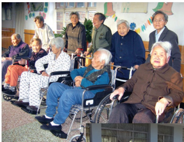
● 為河北省路德莊安老院改善設施