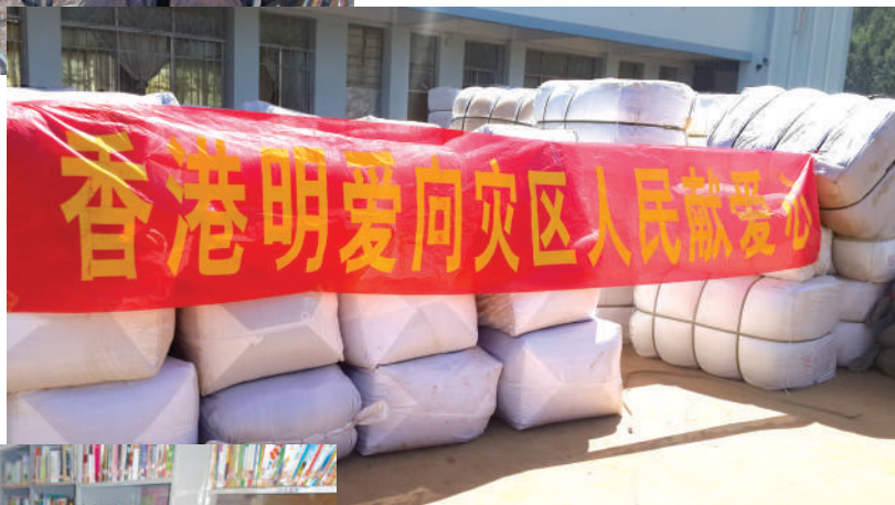
● 雲南省昭通市地震災民獲發棉被和寒衣等物資