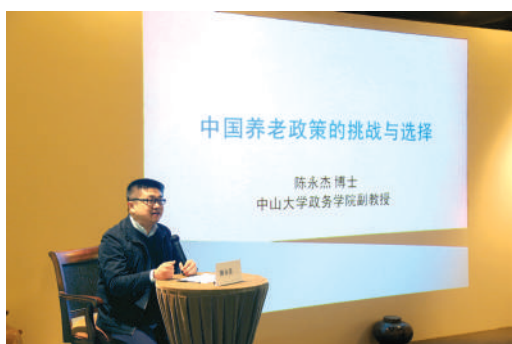
● 中國養老政策講座

2015年1月於廣州舉行了居家安老服務工作坊，該活動是與廣州中山大學人文學會合辦。參與者包括35名來自全國各地安老服務機構的從業員，其中有20名修女。稍後將安排部份學員在內地設備完善的相關服務機構實習觀摩。