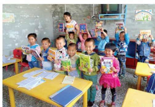
● 山西省天愛幼兒園學生喜獲新書