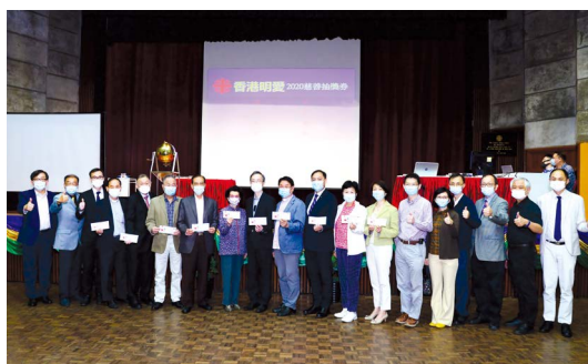
▲ 慈善抽獎券抽獎儀式