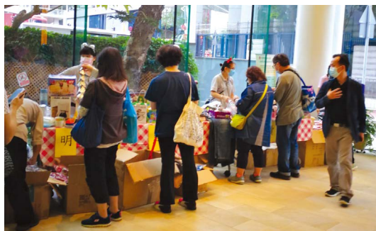
▲ 明愛服務單位舉行小型賣物會