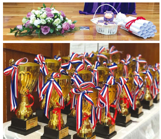
▲ 2020 年天主教四旬期運動

明愛協助委員會舉辦「四旬期愛心學校獎勵計劃」，共有 57 間公教學校及幼稚園合共 652 份作品參選，原定於 2020 年 2 月和 2020 年 5 月舉辦的四旬期簡介會及四旬期頒獎典禮因疫情而取消。