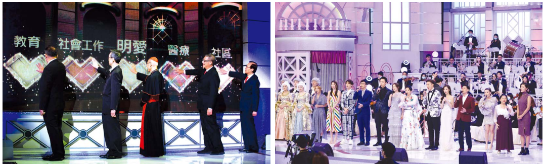
▲「明愛暖萬心」慈善晚會 以歌聲傳揚關愛

工銀亞洲連續 22 年擔任明愛籌款委員會主席，銀行員工鼎力支持及參與各項活動。有賴各界的同心協力，本年度籌款總收入創歷年新高，達至 3,878 萬元，其中 2,219 萬元來自個別善長及「明愛暖萬心」慈善晚會等籌款活動。