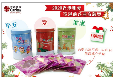
▲ 慈善聖誕曲奇義賣

在限聚令之下，明愛未能在不同地區舉辦公開的大型賣物會。不過，感恩今年仍然得到超過 100 個堂區、學校、團體及明愛服務單位參與小型賣物會，以及新設的「一人一利是」和「門捐」活動，合共籌得 196 萬元善款。