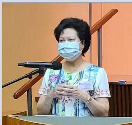
在 2021 年 5 月舉行之「四旬期愛心學校獎勵計劃頒獎典禮」

作為天主教四旬期運動的其中一項活動，明愛協助委員會舉辦「四旬期愛心學校獎勵計劃」，並得到熱烈迴響，共有 172 間公教學校和幼稚園參加，合共提交了 1,688 份參選作品，而頒獎典禮亦已於 2021 年 5 月順利舉行。