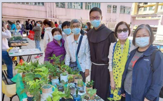
堂區教友舉辦小型賣物會