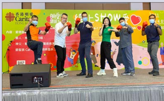
「明愛義賣樂績 FUN」之「網上 SHOW 愛心」