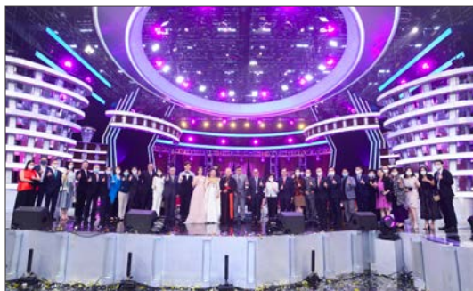
「明愛暖萬心」慈善晚會

工商銀行（亞洲）有限公司連續第 23 年擔任明愛籌款委員會的主席，在其鼎力支持下，我們多項籌款活動均取得佳績，其中包括「明愛暖萬心」慈善晚會、「步中情」線上行和慈善聖誕曲奇義賣，合共籌得近 2,400 萬元的善款。