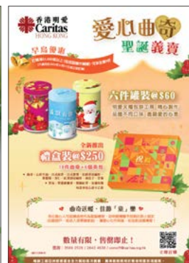
慈善聖誕曲奇義賣