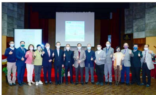
慈善抽獎券抽獎儀式