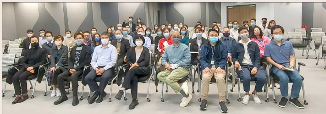
一年一度的教職員反思日