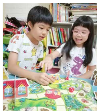
「親愛的哥哥，讓我們一起玩吧！」