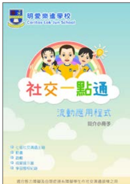
明愛樂進學校推出「社交一點通」流動應用程式，介紹適合智障學生的社交溝通言語治療訓練