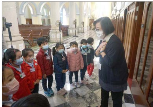
參觀主教座堂時專心地聆聽老師的講解