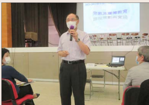
教育服務部副部長分享「明愛宗教、道德和品德教育」