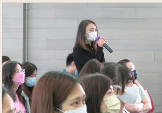
參與者積極發表意見

我們分別於 2021 年 9 月 30 日、2021 年 12 月 20 日及 2022 年 3 月 25 日，舉行了教師發展日，並以「宗教及道德教育」和「創意思考設計教學法 — 探視課程策劃與實踐」為主題，其中包括一個由教育服務部和明愛專上學院同事負責籌辦的工作坊。在工作坊上，參加者分享了有關學與教，例如 4Es ( 探究『思』、表達『言』、探索『起』和體驗『行』) 的實踐經驗。