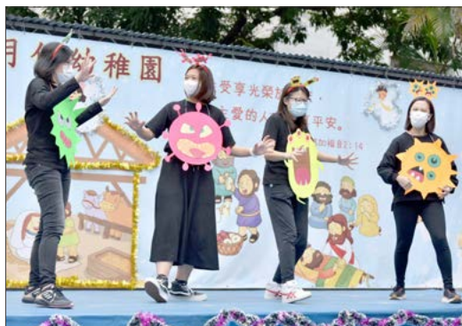
家長進行話劇表演

家長是學校的最佳伙伴，他們在孩子的發展和學習過程中扮演著非常重要的角色。有見及此，我們的服務旨在促進親子關係，提升家長的正向育兒觀和加強家長之間的合作。透過推出一系列家校合作的活動，讓家長在兒童不同的學習階段中都能夠積極參與，以達致兒童的全人發展。