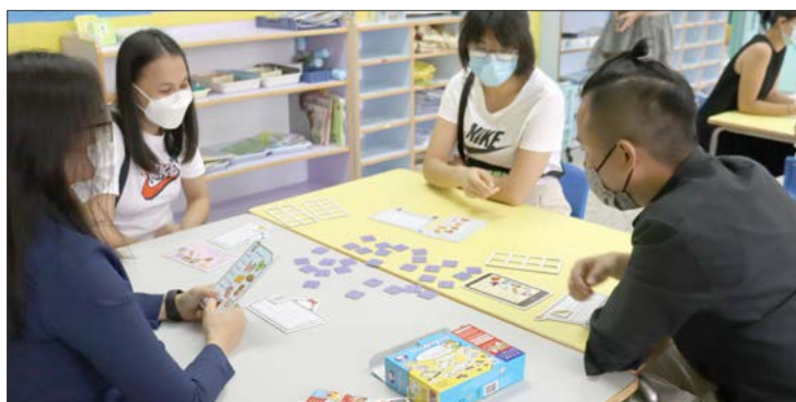
於 2019 冠狀病毒病疫情期間，家長學習如何玩桌上遊戲，並與他們的孩子們一起在家玩樂