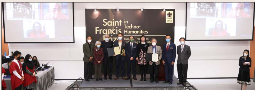
聖方濟各人文科技獎頒獎典禮

明愛專上學院於 2021 年 9 月成立了世界首創的「聖方濟各人文科技獎」，以表揚對發展人文科技作出卓越貢獻的個人或機構。首個頒獎典禮連同建構人文科技文化的學術交流會已於 2022 年 1 月 5 日舉行，當日有幸邀請到教育局常任秘書長李美嫦女士，以及自資專上教育委員會主席張炳良教授擔任頒獎嘉賓。在頒獎典禮上，中國教育部語言文字應用研究所高級研究員馮志偉教授獲頒授第一屆「聖方濟各人文科技獎」(翻譯科技)，而香港城市大學鄒嘉彥教授，以及西班牙馬拉加大學格洛麗亞·科帕斯·帕斯達爾教授則分別獲頒授嘉許狀。