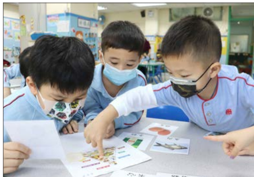
兒童熱衷地學習食物金字塔