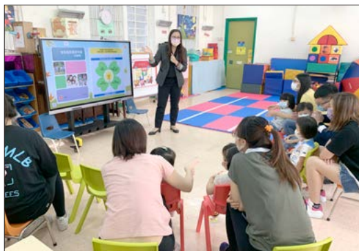
向家長介紹家長教育架構

為了加強家長對兒童發展的了解，特別是年輕夫婦和兒童的照顧者，明愛學前兒童教育資料參考中心所籌辦的家長教育計劃和嬰幼兒親子活動，展現出遊戲對兒童適切發展的重要性。