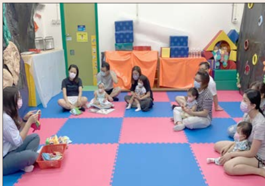
以「與幼兒閱讀故事」為主題的家長講座