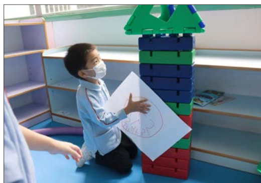
「我可以將時鐘放在鐘樓的最上方。」

為了在早期階段激發兒童的好奇心和創造力，我們運用了各種材料、工具和設備以提升兒童的探索性學習，讓他們學會彼此溝通和尊重他人的意見。此外，關愛文化亦是培養兒童自主學習和領導才能的關鍵。明愛聖方濟各幼稚園在接受教育局質素評核期間，局方對這項成果予以肯定。