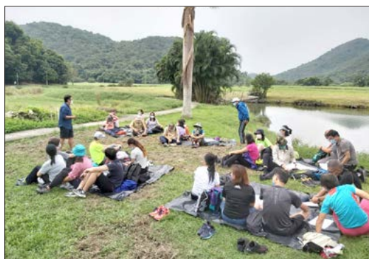
於深涌進行戶外考察

自 2019 冠狀病毒病疫情爆發以來，我們轄下中學和郊野學園在教學及行政工作上均面對不少困難，對維持學校正常運作帶來重大挑戰。儘管在這個嚴峻的情況下，我們轄下中學和郊野學園仍然繼續堅持提供服務，秉承明愛教育的一貫理念，著重學生於德、智、體、群、美及靈等六方面的培養。學校亦舉辦了不同類型的活動，務求為學生提供全面訓練和學習體驗。