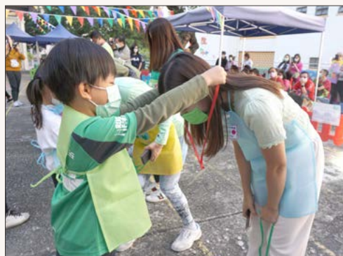
「媽媽，這是我贏得的獎牌呢！」