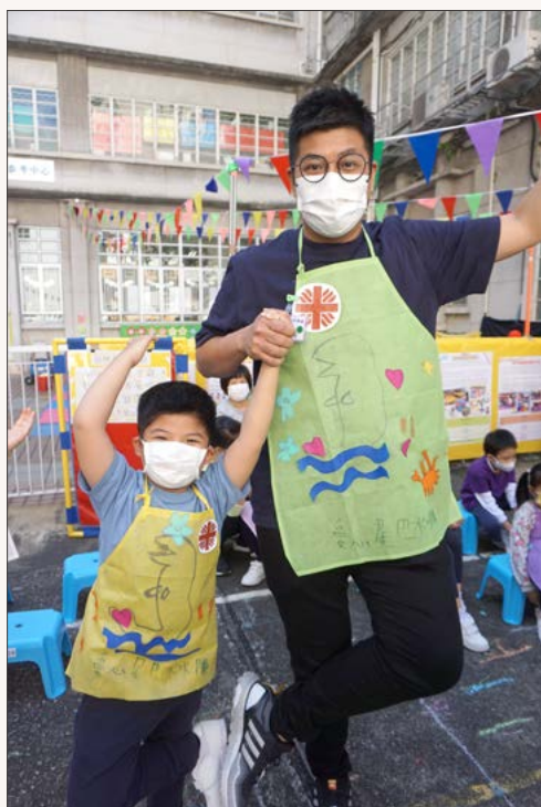
「爸爸，我們是冠軍呢，好啊！」