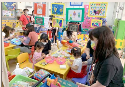
幼兒和父母在創意藝術區自由地玩樂