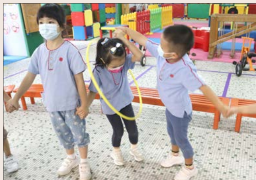
「讓我幫你穿過呼拉圈！」

學前教育服務旨在提供一個愉快的學習環境，並按兒童的能力，培養七歲以下兒童在德、智、體、群、美、靈各方面的均衡發展。