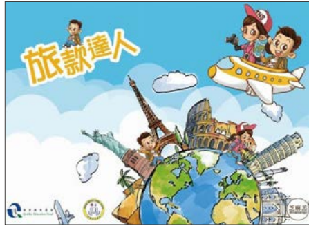
明愛樂恩學校製作「旅款達人」棋盤遊戲，提升學生對學習旅遊及款待科的動力