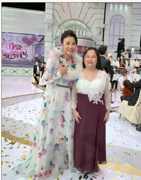
汪明荃博士，GBS和李顯癸同學

我從小對音樂深感興趣，音樂為我的世界帶來了豐富的色彩，因此我希望我的歌聲能夠給別人帶來靈感和希望。尤其在對抗2019冠狀病毒病期間，音樂幫助我釋放出負面情緒，讓我的心靈回復平靜。我希望藉此再一次向學院表示衷心的謝意，我將會繼續努力追求自己的夢想，成為一名專業的音樂人士。