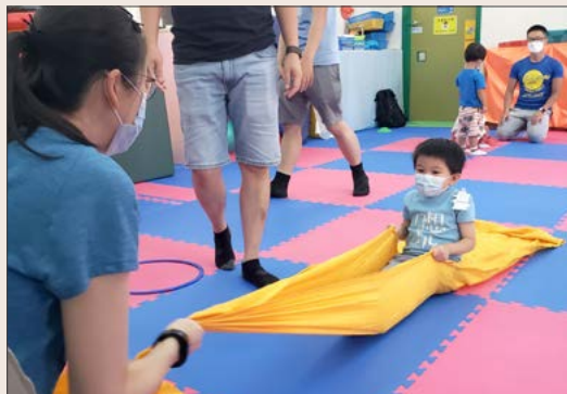
「寶貝，你坐在船上啊！」