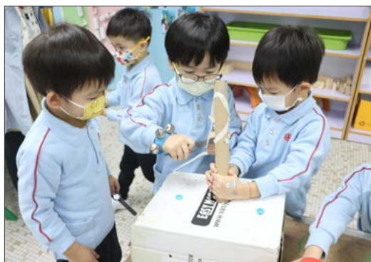
兒童在遊戲室內互相合作