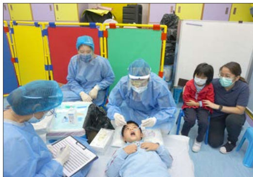
家長充當義工協助舒緩兒童在疫苗接種和牙齒檢查過程中的焦慮