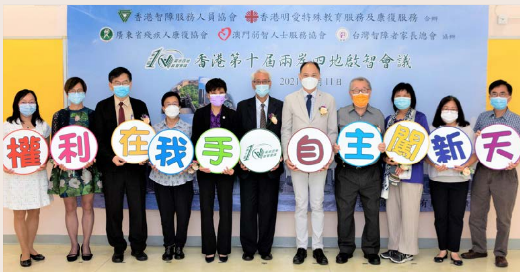
會議的重點包括主題演講、發布追蹤研究結果、青年圓桌研討會、虛擬參觀和表演