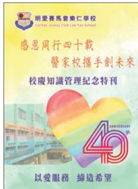
明愛賽馬會樂仁學校出版「校慶知識管理紀念特刊」，總結過去40年在知識管理發展方面的成就