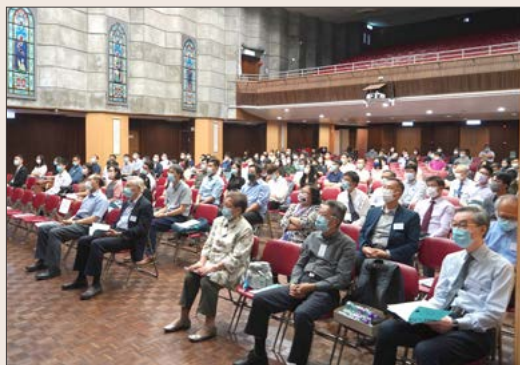
新入職同事的迎新日