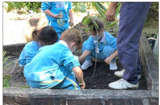
幼稚園學生在校舍內種植土沉香

此項為期兩年的計劃於2021年12月圓滿結束，惠及397位幼稚園教師和960名幼兒。計劃內容包括教師培訓工作坊、師生體驗工作坊、觀課，以及種植土沉香的活動，當中亦製作了《生物多樣性教學手冊》、《生物多樣性圖鑑》和《親子遊蹤》三本出版物，並設有網站向業界及公眾分享相關資訊。