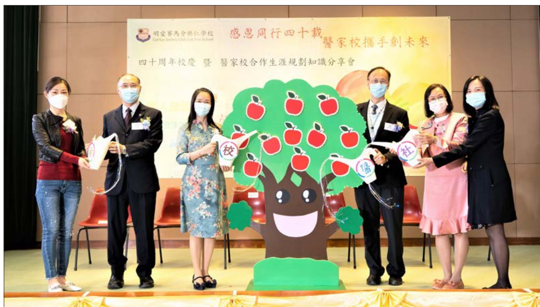
開幕典禮暨知識分享會

明愛賽馬會樂仁學校於 2021 年 11 月 13 日舉行校慶開幕典禮暨「嚴重智障學生在醫、家、校合作生涯規劃」知識分享會。