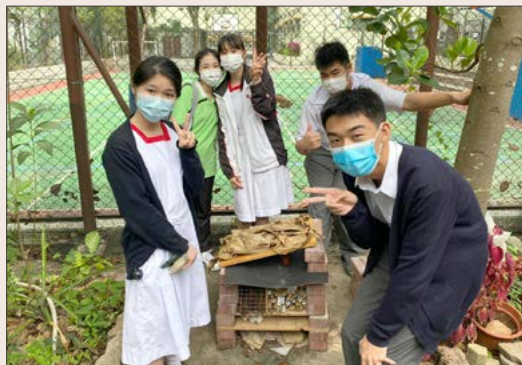
在校園內設置「昆蟲酒店」