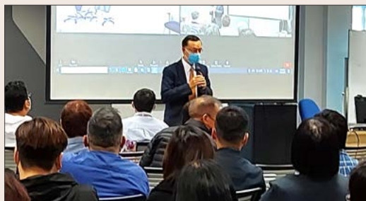
準備機構審查的個案研究講座

於過去一年，我們一共舉辦了 63 個不同主題的員工持續發展活動，包括了 50 個內部培訓活動和 13 個專業協作培訓活動。我們約有 260 名教職員同事參加了一年一度的教職員反思日，其中學術人員參加了個案研究講座，為成為私立大學而進行機構審查的工作做準備，而行政人員則參加了團隊建設活動。