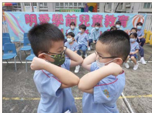
「讓我們向爸爸和媽媽示範這個遊戲吧！」