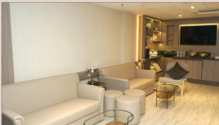
全新的醫生休息室