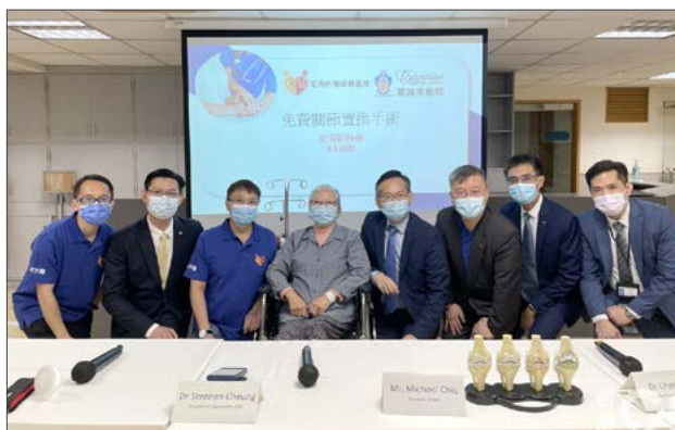
免費全膝關節置換資助計劃