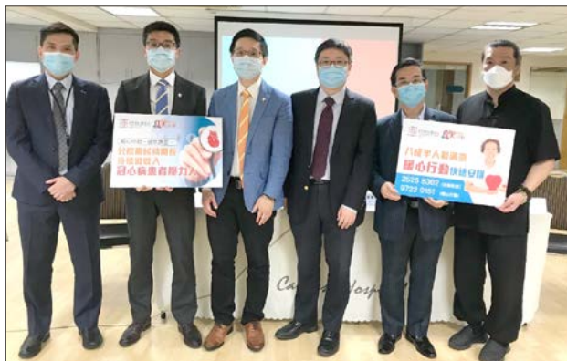
為公立醫院病人提供冠狀動脈介入治療術（俗稱「通波仔」手術）