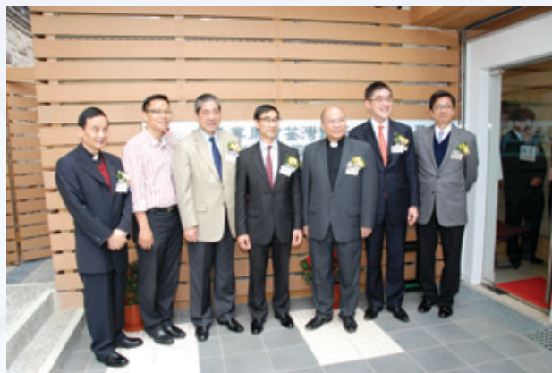
眾嘉賓攝於診所的開幕典禮