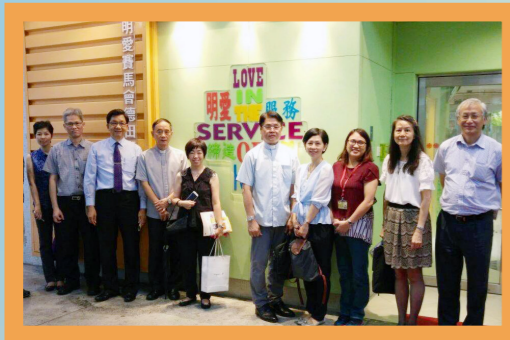
參觀明愛社會工作服務單位

大家從公教報的報導中已簡知梅神父的背景和聖召歷程，但我們藉此機會希望能對梅神父有更進一步的認識；尤其是由銀行一個商業機構，轉而成為神父擔任牧民工作，到現在加入明愛，當中的心路歷程究竟如何？