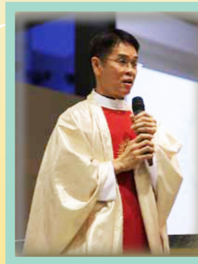
新司鐸聖秩禮儀後的致詞

作為領導階層，要清楚知道機構的方向、策略和願景。並能掌握發展的重點，至於「管理之道」，很簡單地說就是與你們一起努力「打拼」。當然，同時都要多聽和多溝通。因為只有這樣才能明瞭不同的立場，從而「對症下藥」，把事情做得更好！