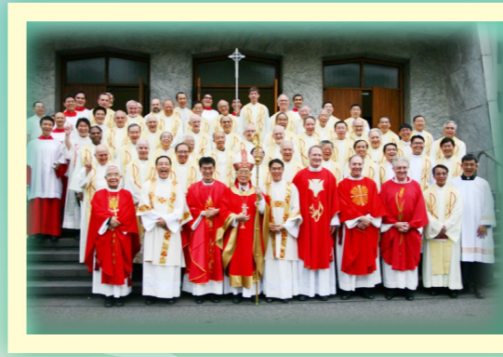
在台北聖家堂領受執事職位