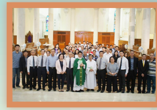
明愛轄下中學公教教職員開學彌撒