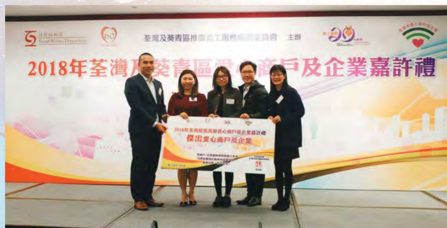
▲計劃獲得荃灣及葵青區傑出愛心商戶及企業嘉許

明愛全樂軒於2010年成立，為荃灣區提供一站式綜合社區精神健康支援服務及復康服務。於2017年12月，中心成功邀得牛奶有限公司宜家家居（荃灣店）開展名為「友工作」工作體驗計劃，成為社區合作伙伴。一年半間，此工作體驗計劃共推行了五期，為八名精神病復元人士