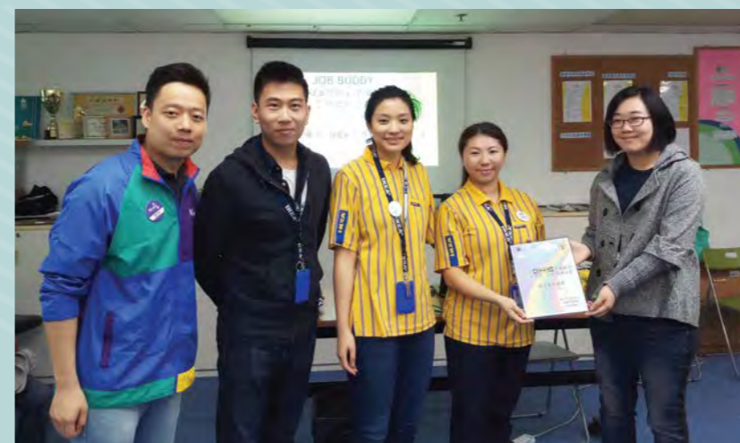
◀致送紀念狀給宜家團隊同工