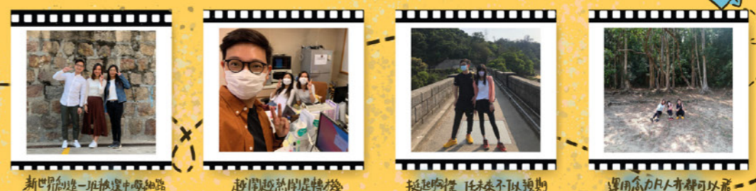
新世界創進一班排連中學細路 超偉超熱熱是轉機 挺起胸膛 任未來不以預期 運用全力/人齊群可以飛