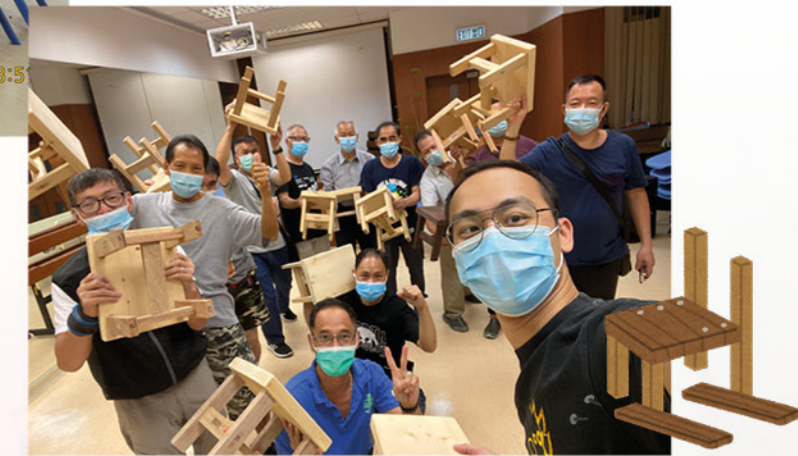
男士小組完成椅子製作，十分雀躍！

「環保就係話咁易！」親子工作坊，讓參加者合作將重用的玻璃樽或膠樽透過大理石彩繪增添色彩，賦予新的意義和價值。家長表示，此活動可讓他們與小朋友認識到環保原來可以很美麗，使心情也變得愉快。