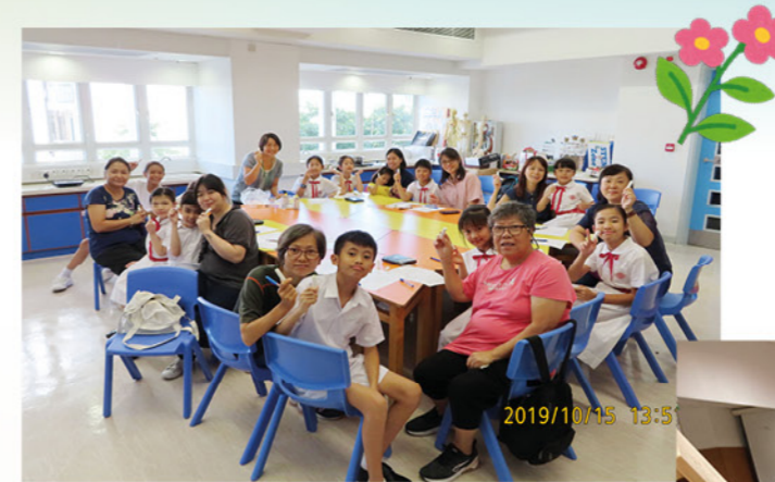
親子環保工作坊一家長及孩子一同製作天然潤唇膏