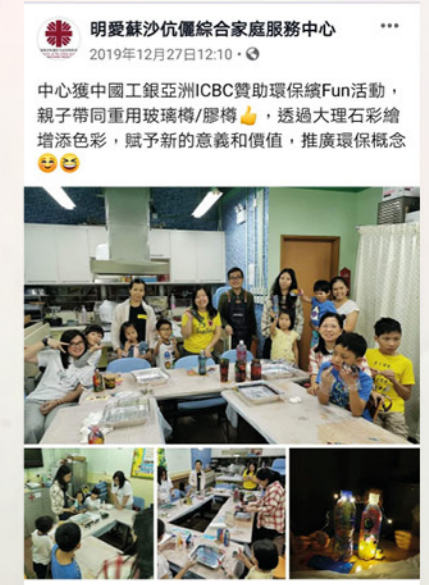
透過臉書分享環保活動花絮