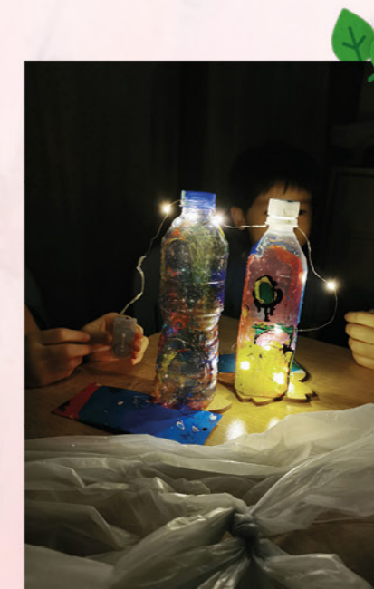
大理石彩繪令重用膠樽變得精美及實用

另外，鑒於參加者喜愛動手製作，因此也舉辦了不同類型的環保DIY工作坊，增強參加者完成製作的能力感。例如明愛屯門綜合家庭服務中心的男士小組學會以入榫方式製作木椅，他們都為製成品感到十分雀躍，同時又學習珍惜木材的環保概念。