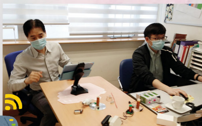
工程師線上指導學生製作無線發電裝置

社工亦鼓勵家長與孩子一起參與活動，透過環保活動過程促進親子關係。例如聖母無玷聖心學校舉辦的「親子環保工作坊」，讓家長及孩子一同製作天然潤唇膏，提升環保意識，一同享受親子時間。明愛蘇沙伉儷綜合家庭服務中心舉辦的