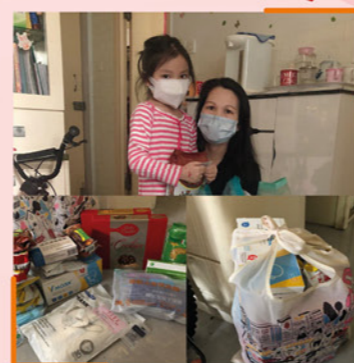
▲ 部分受惠家庭及兒童