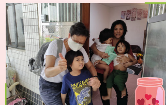
▲ 透過關懷行動，疫情下築起人與人之間的真摯連繫