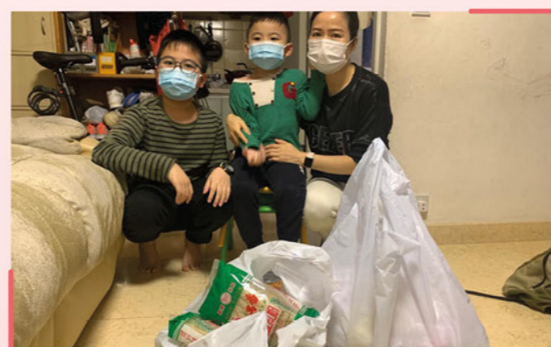
▲ 「居家抗疫」送暖行動的受惠家庭