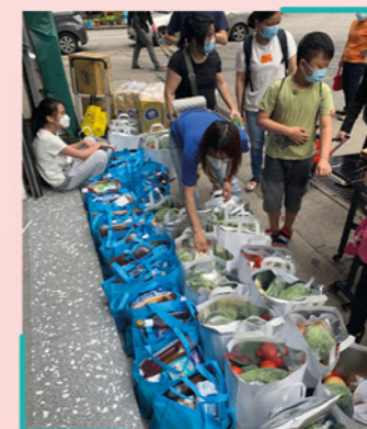
▲ 媽媽義工和子女一起包裝物資包