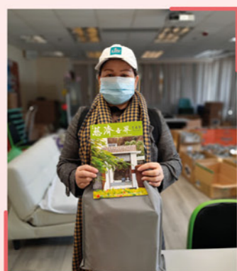
▲ 佛教慈濟基金會香港分會送出抗疫物資及食物包