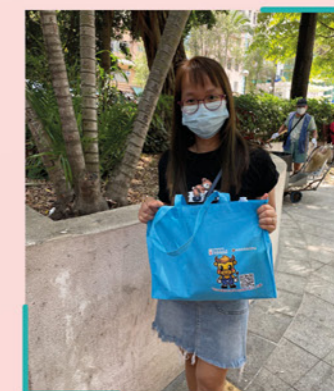
▲ 區內家庭收到物資包