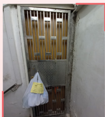
▲ 工作人員到戶派送食物、快測包等物資

本中心策劃了「居家抗疫」送暖行動，為確診居民提供食物、快測包等物資並到戶派送。同時感謝紅十字會、佛教慈濟基金會香港分會及其他善長，在艱難時期伸出援手，為鄰舍提供抗疫物資及資源，與他們共渡時艱，為社區中的基層家庭送上關懷，給予他們支持與希望。