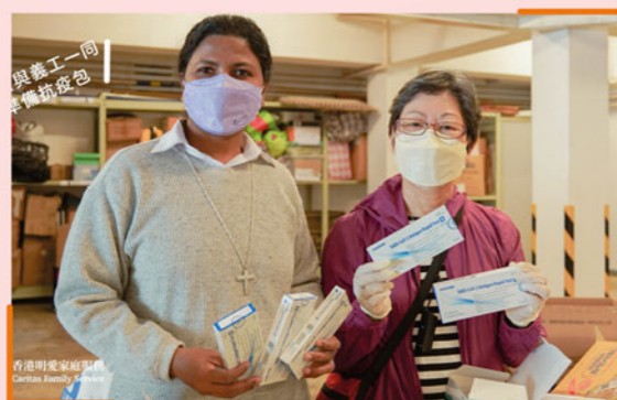
▲ 聖葉理諾堂修女與教友義工一同製作福袋